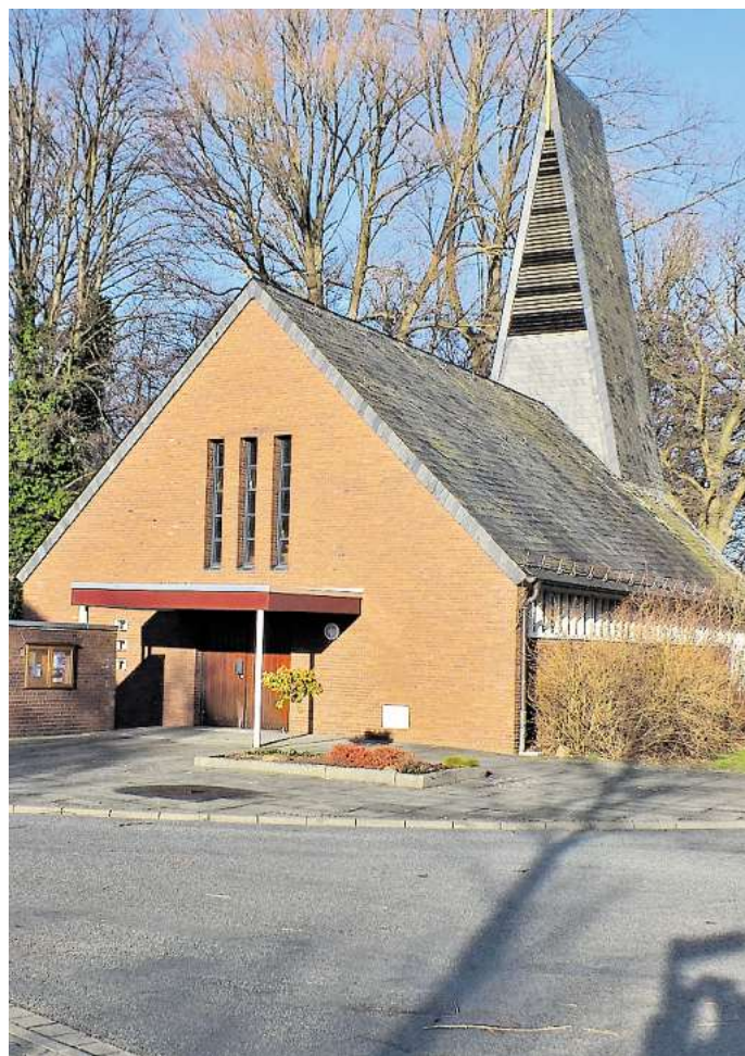
Vor 50 Jahren wurde die Kapelle in Alvesse geweiht. Das Jubiläum wird am Sonntag gefeiert.

Die Macht des Bösen solle von der Kirche ferngehalten werden, sagte der damalige Landessuperintendent Peters aus Celle bei der Weihe. Dies schien im letzten Jahrhundert erfüllt worden zu sein. Nach dem ersten Glockenläuten und dem Gottesdienst fand 1963 eine Zusammenkunft der Gäste statt, die sich über das gelungene Werk freuten, wie die Peiner Allgemeine Zeitung berichtete. Die damalige Zeremonie erinnert stark an das geplante Programm des Jubiläums. Bleibt zu hoffen, dass es auch 2013 eine rundum gelungene Veranstaltung wird – so wie 1963. mea