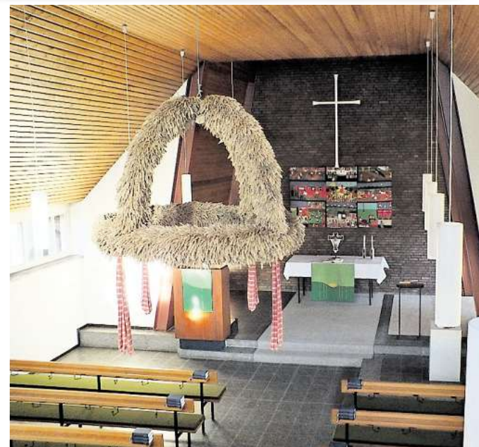
Das Stahlskelett der Kapelle während der Bauzeit (oben) und das Gotteshaus von innen.